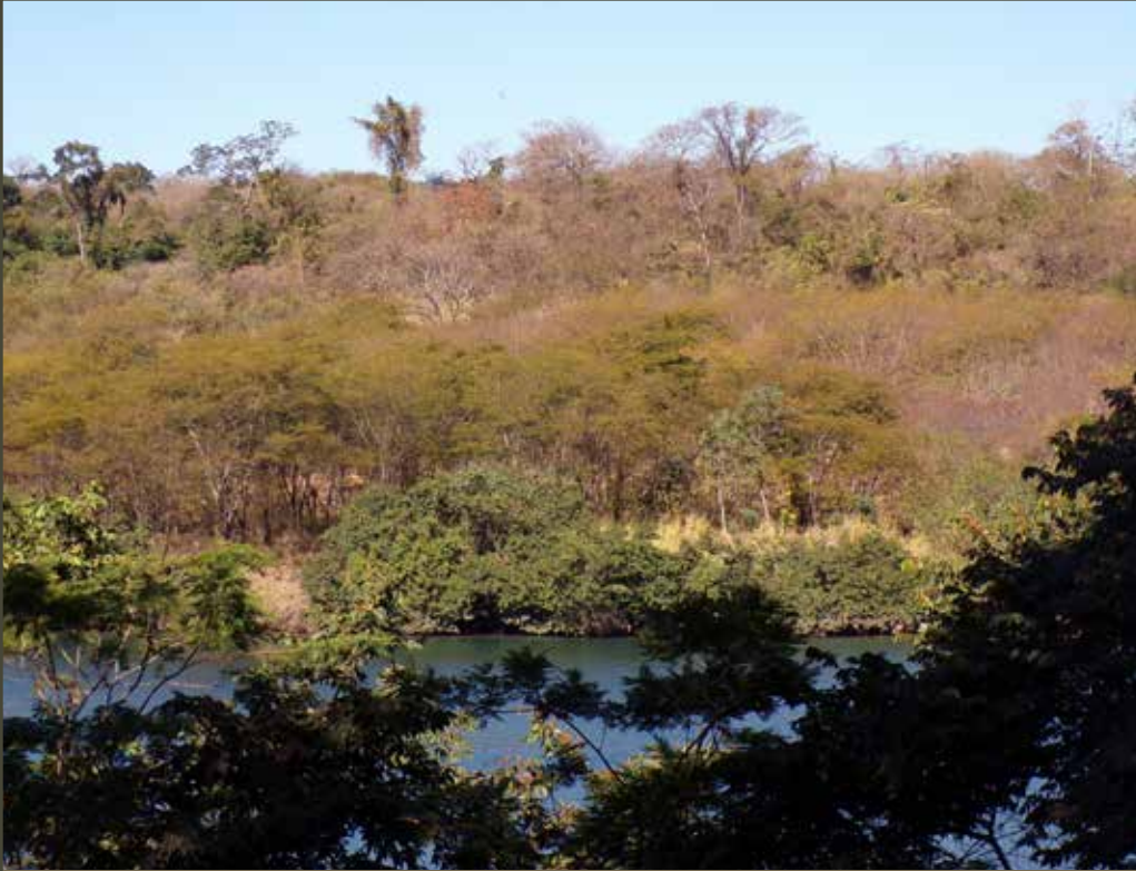
MELISSA FARIAS CHAVES