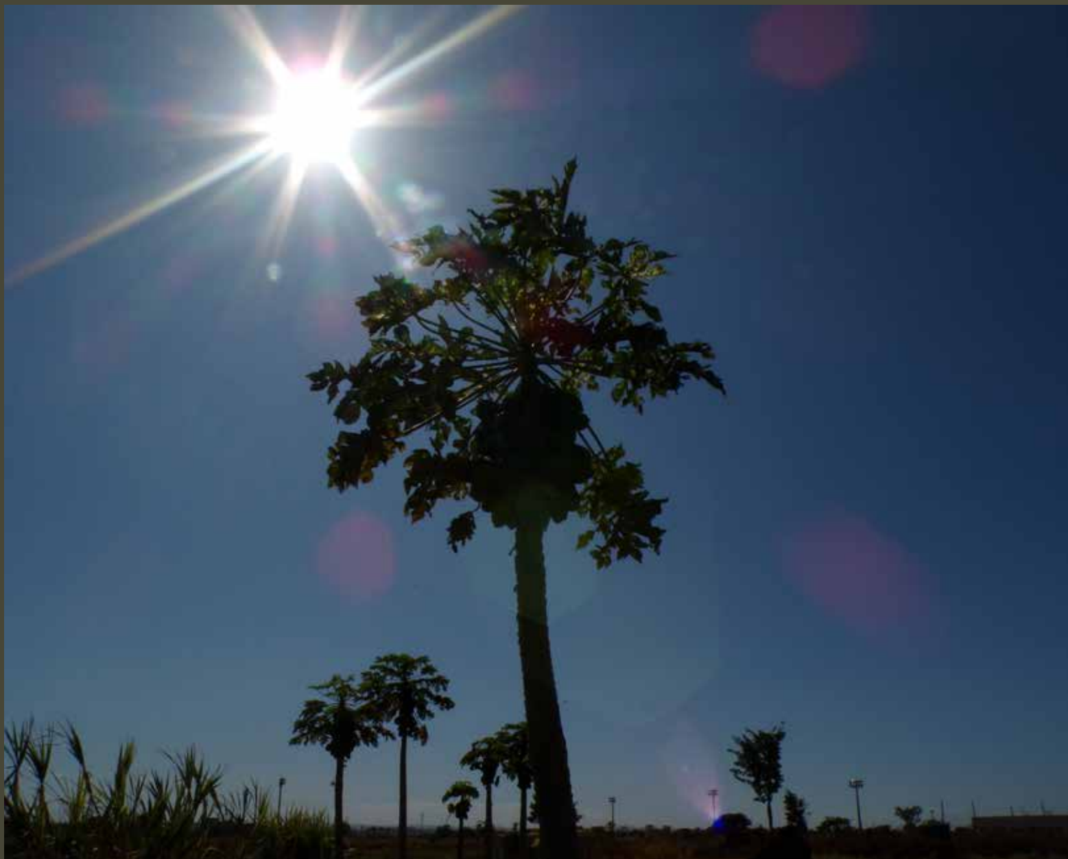
MELISSA FARIAS CHAVES

Além de iluminar as fotos e deixar as paisagens ainda mais lindas, a luz do sol também é considerada uma energia renovável.