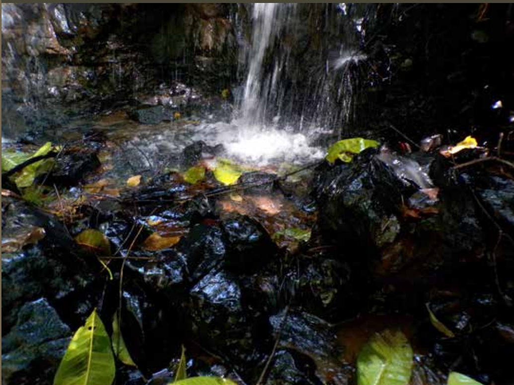
MELISSA FARIAS CHAVES