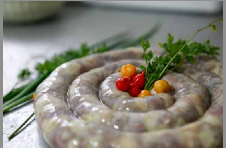
Preparação da tradicional linguiça bovina de Maracaju.