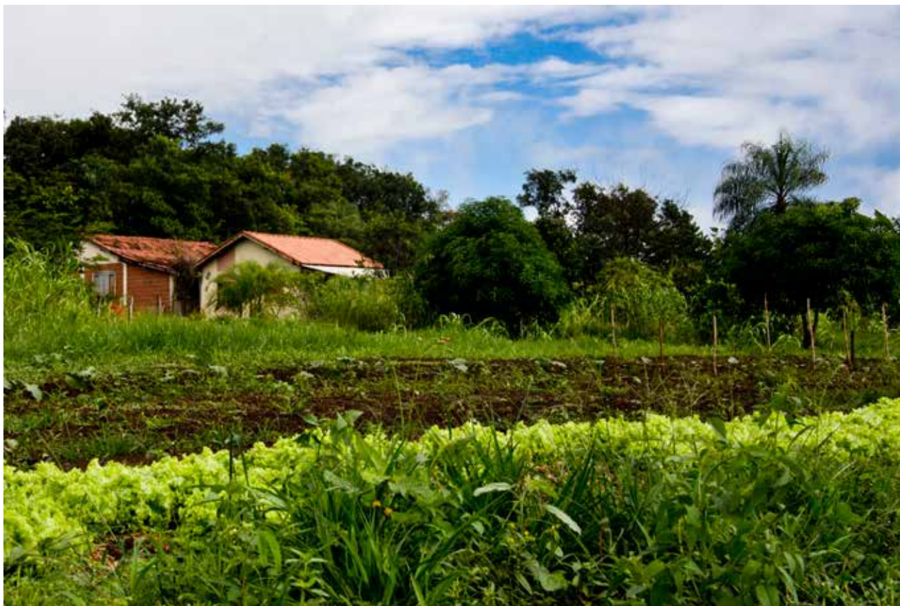
Comunidade Quilombola São Miguel e Feira do BNH.

O incentivo à agricultura familiar entre os produtores locais fomenta uma economia mais saudável e justa. Em Maracaju, os agricultores locais fornecem suprimentos para a merenda escolar da rede pública, enquanto a administração local oferece espaço a realização de feiras livres, além de cursos de aprimoramento e desenvolvimento. Parcerias como esta são exemplos de boas práticas que poderiam ser pensadas e retransmitidas para outras comunidades.