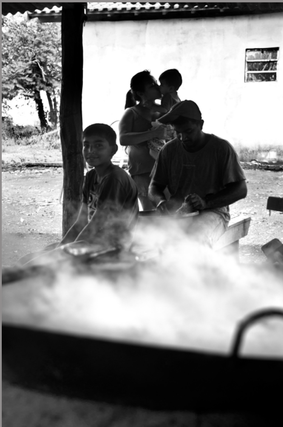
Preparação de rapadura. Agricultura Familiar. Comunidade Quilombola São Miguel.