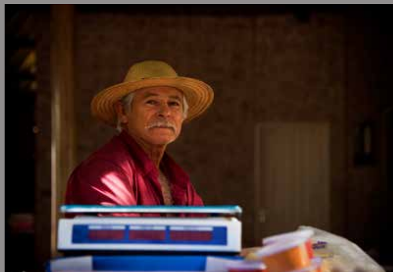
Vista da fazenda, plantação de pimenta e feira.