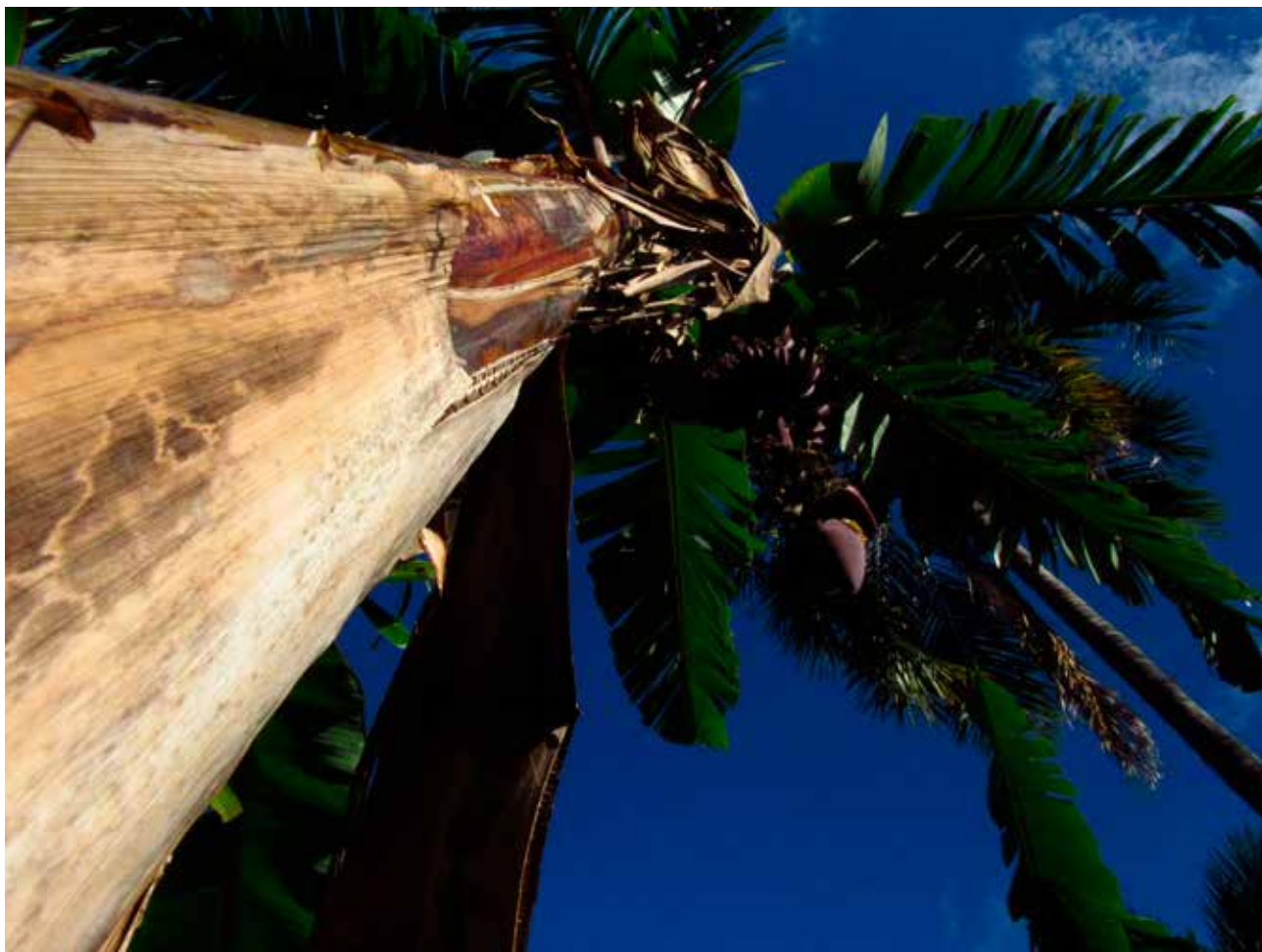
Gutemberg Nascimento de Souza