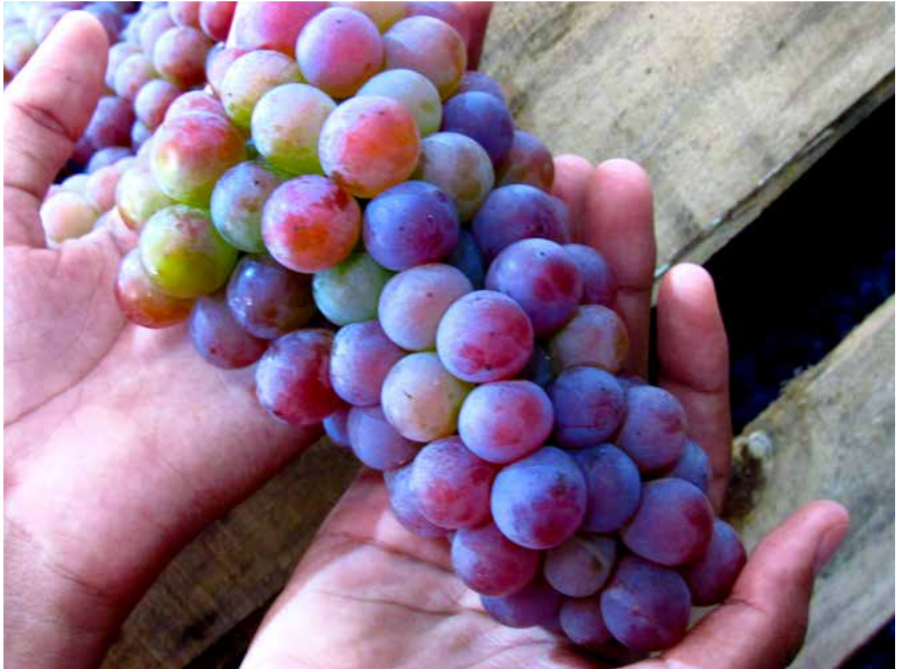
Camilly Caetano de Souza