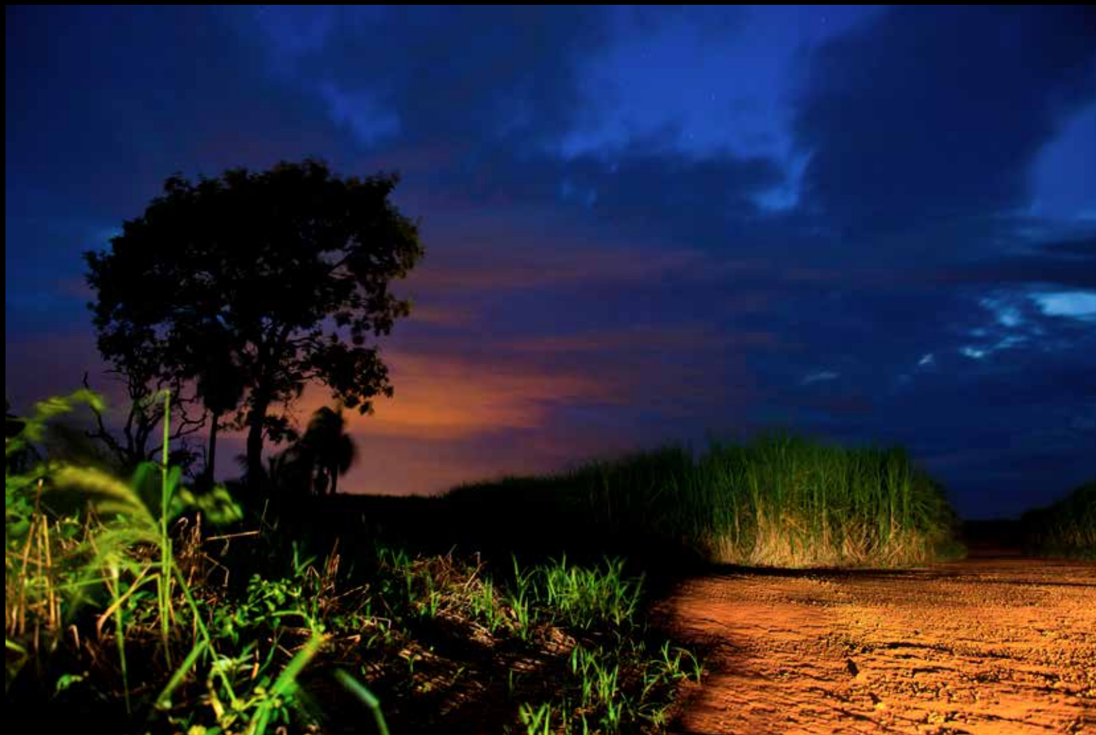
Vista noturna de canavial