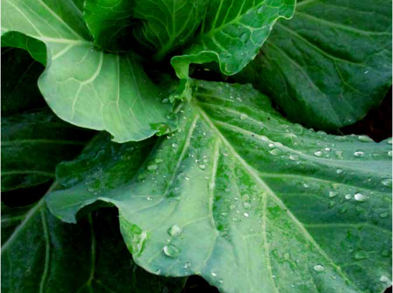
Camilly Caetano de Souza